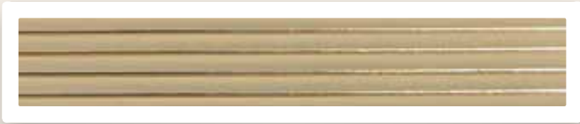
Flachstreifen 4 mm