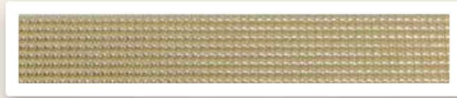
Perstreifen 2 mm