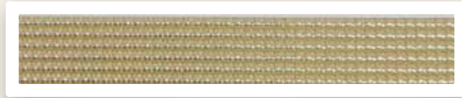
Perstreifen 3 mm