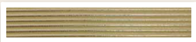
Rundstreifen 3 mm