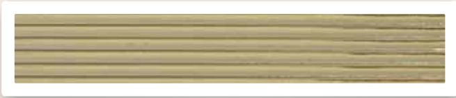
Flachstreifen 3 mm