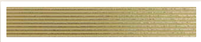
Rundstreifen 2 mm