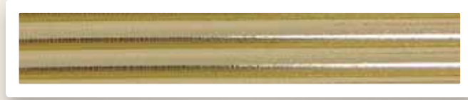
Rundstreifen 7 mm