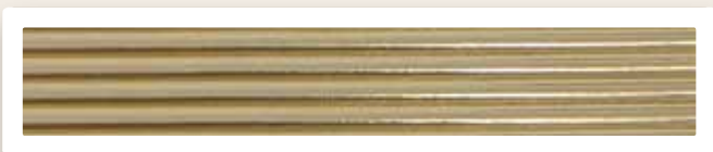
Rundstreifen 4 mm