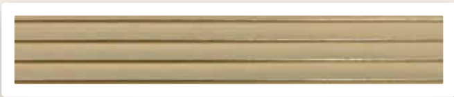
Flachstreifen 5 mm