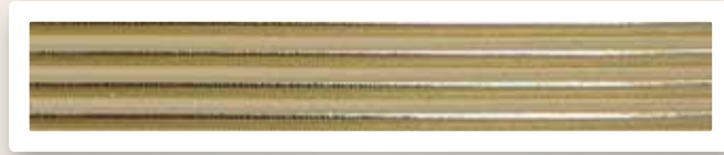
Rundstreifen 5 mm