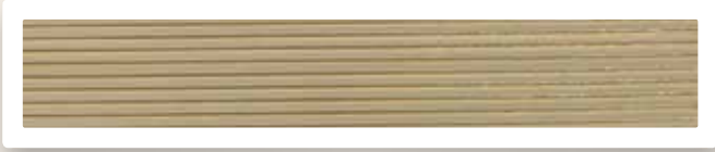
Flachstreifen 2 mm