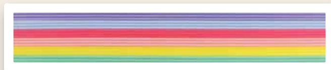
Streifenset pastell - 18 Rundstreifen 2 x 200 mm