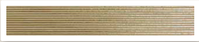
Flachstreifen 1 mm