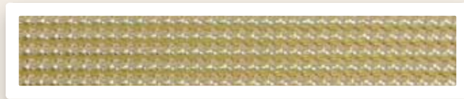
Perstreifen 4 mm