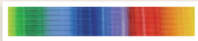
Flachstreifen 3 mm Regenbogen