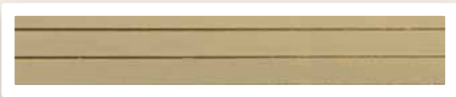
Flachstreifen 7 mm